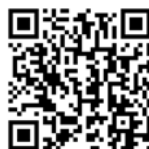
Гайд по работе кассы

время. Оставляю здесь полезный гайд: он поможет разобраться с устройством кассы, ее выбором, покупкой и регистрацией — все пошагово, с картинками. Там же есть советы, как действовать в нестандартных ситуациях: скажем, если отключились интернет или электричество.