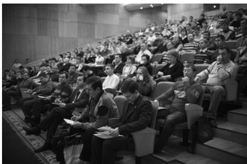
Один из семинаров в Академии «Форекс Клуба» в Москве

Надо сказать, и состоятельные трейдеры с миллионными счетами также предпочли нас