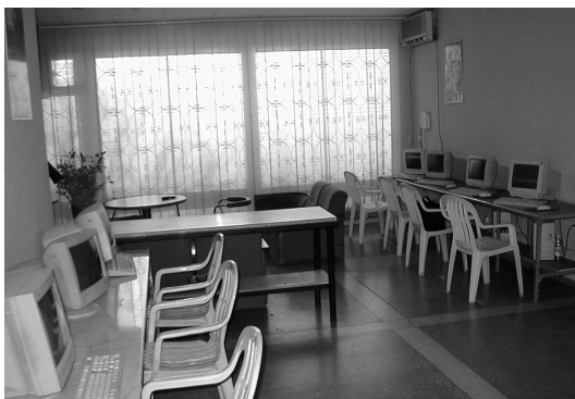
Первый офис «Форекс Клуба»