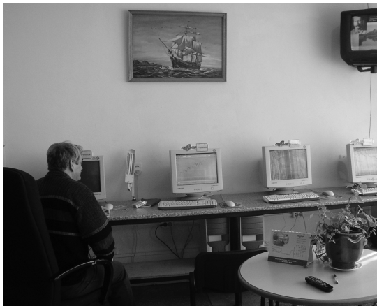
Редкие минуты затишья на рынке

Вечерами «бывалые» выходили на крыльцо и делились своими впечатлениями от торговли, пересыпая речь непонятными новичкам словами. Студенты слушали эти рассказы, раскрыв рты, и мечтали поскорее вырасти в таких же «рыбных» специалистов.