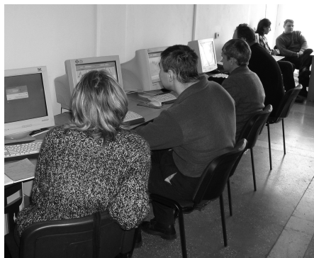
Первые клиенты, первые сделки