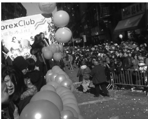
Машина «Форекс Клуба» в составе колонны во время празднования китайского Нового Года в China Town, Manhattan

Конкуренты, еще недавно бегущие вровень по соседней дорожке, снова отстали и позволили нам зазаскучать.