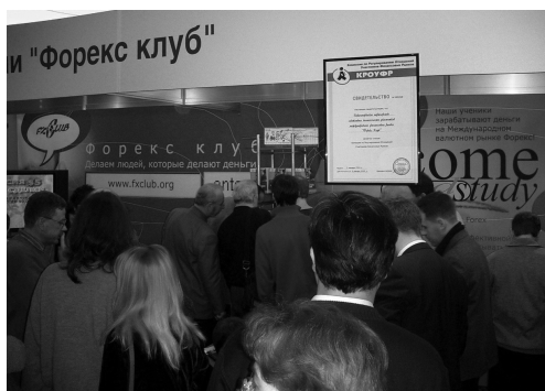
Потенциальные клиенты вокруг нашего стенда на выставке Forex Expo

Впервые я ощутил потерю интереса. Возникло предчувствие тупика. Ты его еще не видишь, только угадываешь. Продолжаешь двигаться по инерции, заданной десять лет назад жесткими обстоятельствами выживания, и осознаешь в глубине души, что твое движение больше не синхронизируется ни со средой, ни с твоим «я». Все чаще я стал задумываться, тем ли я занимаюсь, мое ли это призвание. Стал регулярно размышлять на тему «что останется после меня».